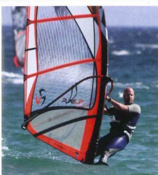
1. SURF-TREFFEN IN TARIFA / SPANIEN